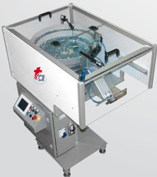
Automate de Comptage

Notre expérience nous permet de répondre à toutes vos demandes.