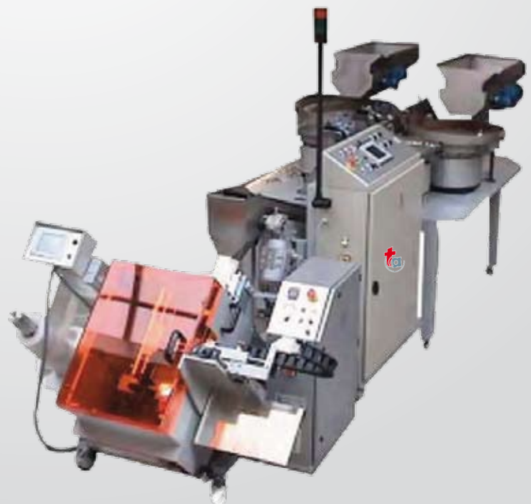
Automates de Comptage + Machine à Ensacher TEC 20