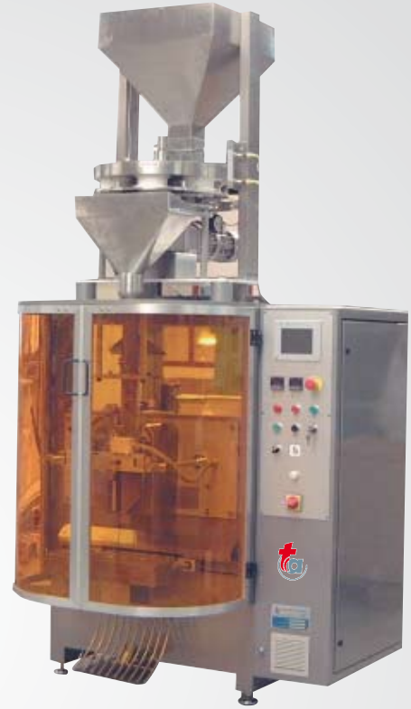
Doseur Volumétrique à Tasses + Machine à Ensacher TEC 50

Ces lignes de conditionnements ont été étudiées et assemblées dans nos ateliers de SAINT GERMAIN LAVAL (42)