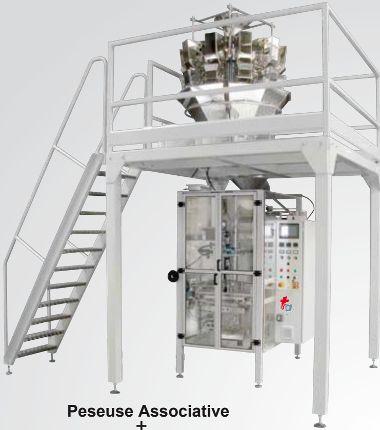
Peseuse Associative + Machine à Ensacher TEC 55

Ces lignes de conditionnements ont été étudiées et assemblées dans nos ateliers de SAINT GERMAIN LAVAL (42)